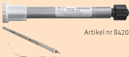
Artikel nr 8420

Motor LT28 är avsedd för kabelbunden styrning via transformator och strömställare. Strömställare anpassad för 24V som polvänder. Drivspänning via transformator med 24V